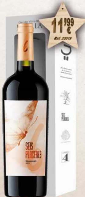
MAGNUM 1,5 L. Vino 6 PLACERES Roble D.O. Jumilla