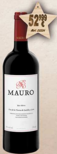
MAGNUM 1,5 L. Vino MAURO I.G.P. Tierra Castilla