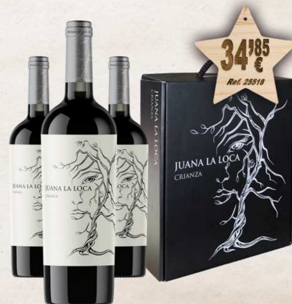
Estuche Cartón 3 Botellas Vino JUANA LA LOCA D.O. Jumilla Crianza 75 cl.