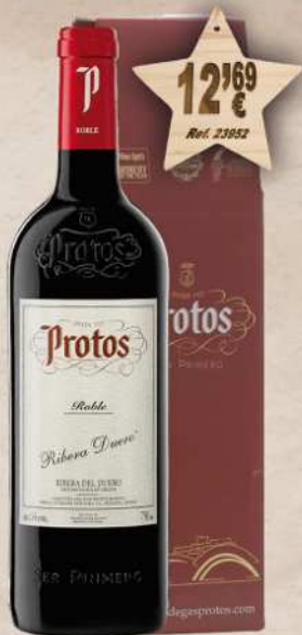
MAGNUM 1,5 L. Vino PROTOS Roble D.O. Ribera Duero