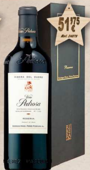
MAGNUM 1,5 L. Vino VIÑA PEDROSA Reserva D.O. Ribera Duero