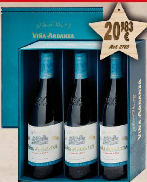
Estuche Cartón 3 Botellas Vino VIÑA ARDANZA Reserva 75 cl. D.O. Rioja Reserva 75 cl.