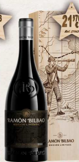
MAGNUM 1,5 L. Vino RAMÓN BILBAO Edición Limitada D.O. Rioja