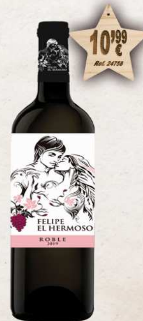
MAGNUM 1,5 L. Vino FELIPE EL HERMOSO Roble D.O. Ribera Duero