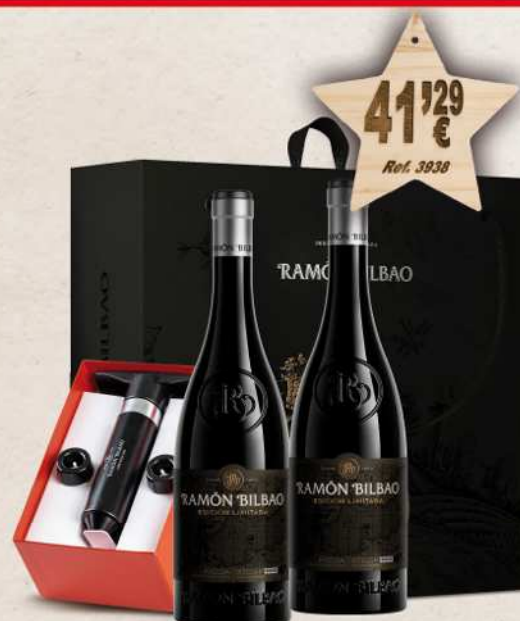
Estuche Cartón 2 Botellas Vino RAMON BILBAO Edición Limitada 75 cl. + Bomba Vacío