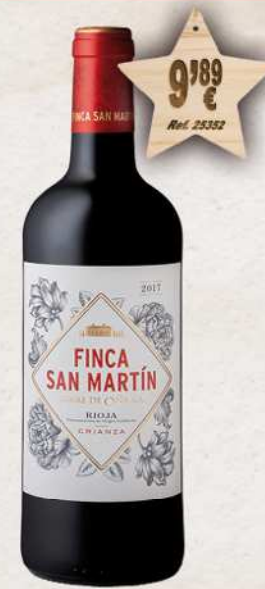
MAGNUM 1,5 L. Vino FINCA SAN MARTIN Crianza D.O. Rioja