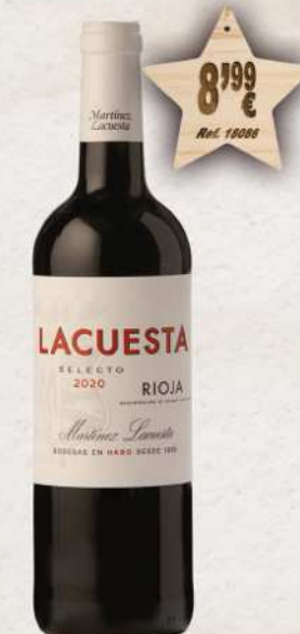
MAGNUM 1,5 L. Vino MARTINEZ LACUESTA 6 Meses Barrica D.O. Rioja