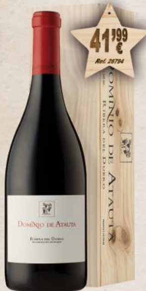
MAGNUM 1,5 L. Vino DOMINIO DE ATAUTA Crianza D.O. Ribera Duero