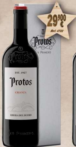
MAGNUM 1,5 L. Vino PROTOS Crianza D.O. Ribera Duero