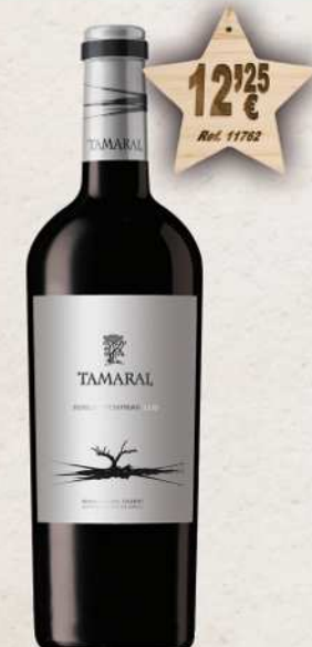
MAGNUM 1,5 L. Vino TAMARAL Roble D.O. Ribera Duero