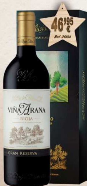
MAGNUM 1,5 L. Vino VIÑA ARANA Gran Reserva D.O. Rioja