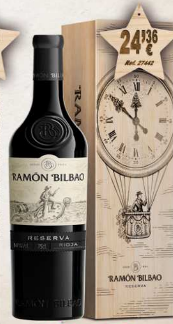
MAGNUM 1,5 L. Vino RAMÓN BILBAO Reserva D.O. Rioja