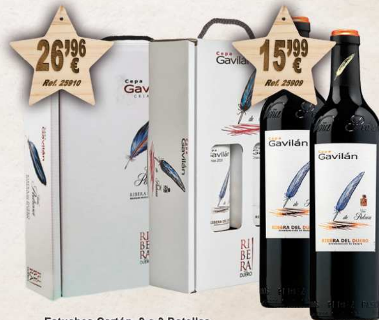
Estuches Cartón 2 o 3 Botellas Vino CEPA GAVILAN Crianza 75 cl. D.O. Ribera Duero