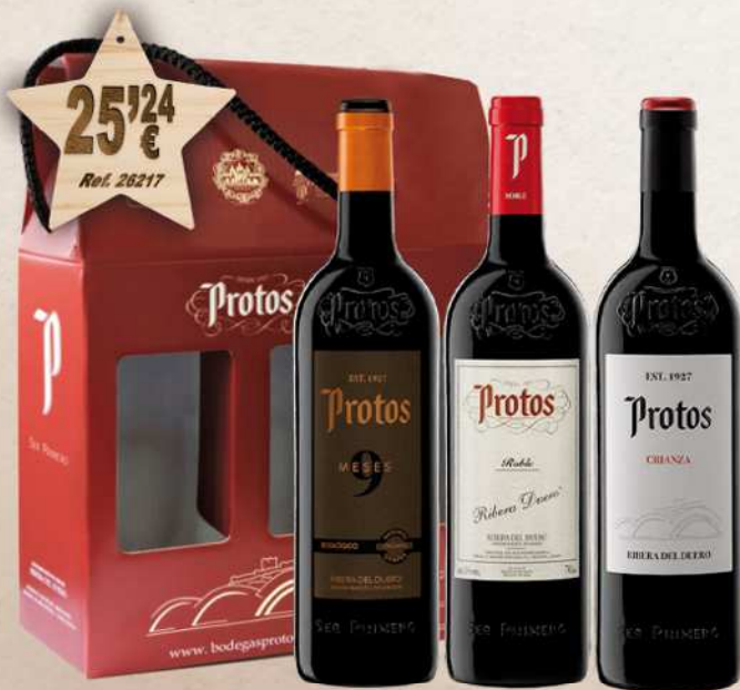
Estuche Cartón 3 Botellas Vino PROTOS Selección D.O. Ribera Duero 75 cl.