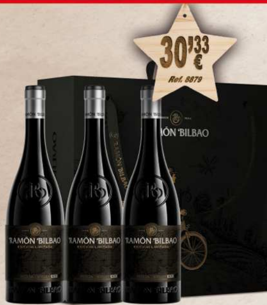
Estuche Cartón 3 Botellas Vino RAMON BILBAO Edición Limitada 75 cl.