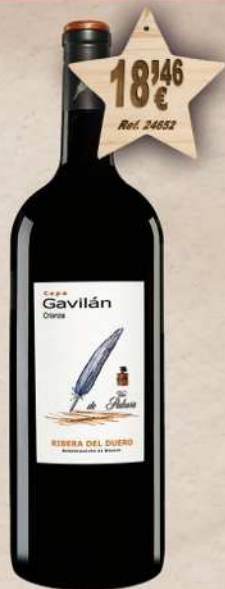
MAGNUM 1,5 L. Vino CEPA GAVILAN Crianza D.O. Ribera Duero