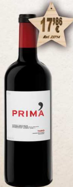
MAGNUM 1,5 L. Vino PRIMA D.O. Toro