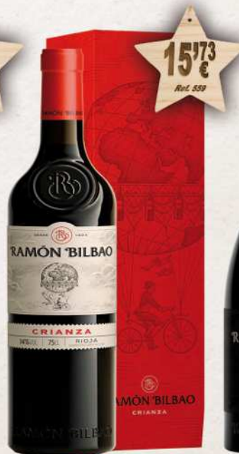
MAGNUM 1,5 L. Vino RAMÓN BILBAO Crianza D.O. Rioja