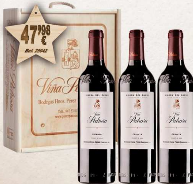
Estuche Madera 3 Botellas Vino VIÑA PEDROSA Crianza D.O. Ribera Duero 75 cl.