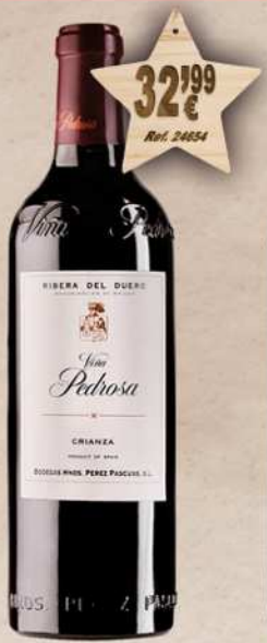
MAGNUM 1,5 L. Vino VIÑA PEDROSA Crianza D.O. Ribera Duero