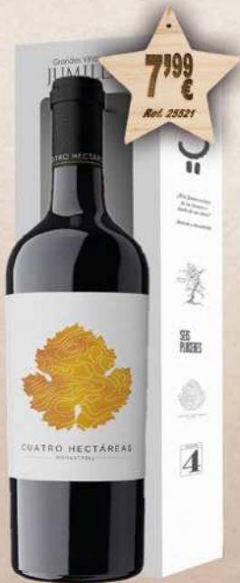
MAGNUM 1,5 L. Vino 4 HECTÁREAS Roble D.O. Jumilla