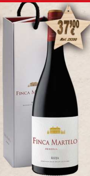
MAGNUM 1,5 L. Vino FINCA MARTELO Reserva D.O. Rioja