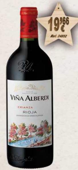
MAGNUM 1,5 L. Vino VIÑA ALBERDI Crianza D.O. Rioja