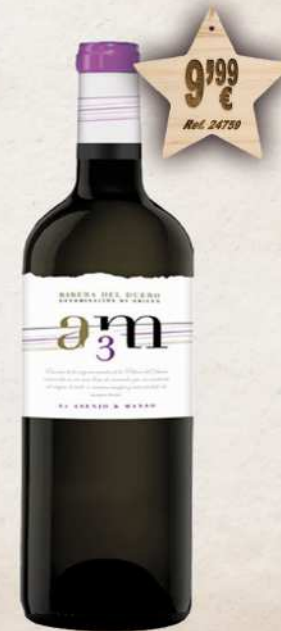
MAGNUM 1,5 L. Vino AM3 Roble D.O. Ribera Duero