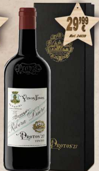
MAGNUM 1,5 L. Vino PROTOS '27 D.O. Ribera Duero