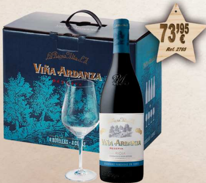
Estuche Cartón 4 Botellas Vino VIÑA ARDANZA Reserva 75 cl. D.O. Rioja + 4 Copas Vino