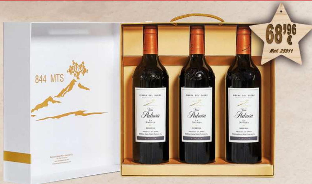
Estuche Cartón 3 Botellas Vino VIÑA PEDROSA La Navilla Reserva 75 cl. D.O. Ribera Duero