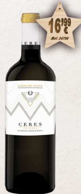
MAGNUM 1,5 L. Vino CERES Crianza D.O. Ribera Duero