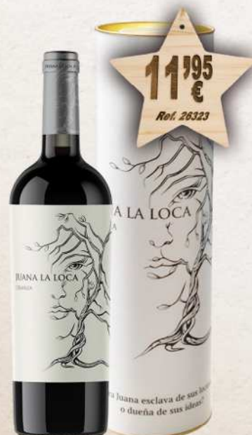
Estuche Cartón 1 Botella Vino JUANA LA LOCA D.O. Jumilla Crianza 75 cl.