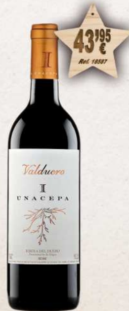
MAGNUM 1,5 L. Vino VALDUERO I Cepa D.O. Ribera Duero