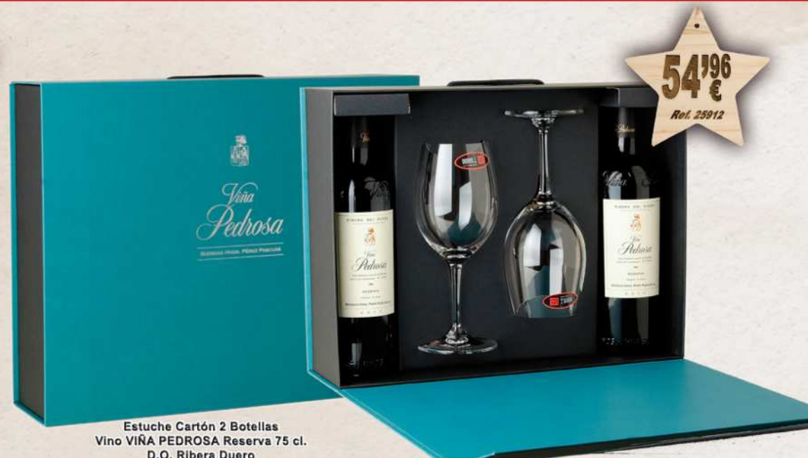
Estuche Cartón 2 Botellas Vino VIÑA PEDROSA Reserva 75 cl. D.O. Ribera Duero + 2 Copas