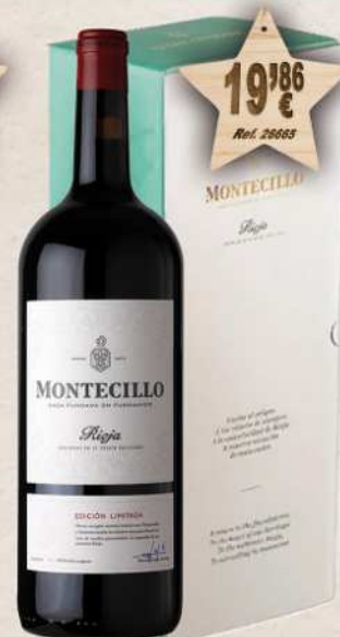
MAGNUM 1,5 L. Vino MONTECILLO Edición Limitada D.O. Rioja