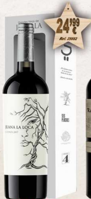
MAGNUM 1,5 L. Vino JUANA LA LOCA Tinto de Autor D.O. Jumilla