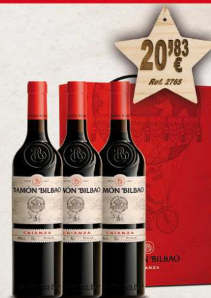
Estuche Cartón 3 Botellas Vino RAMON BILBAO Crianza 75 cl.