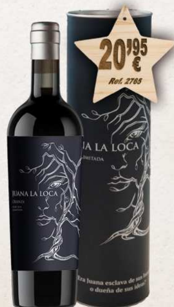
Estuche Cartón 1 Botella Vino JUANA LA LOCA D.O. Jumilla Crianza 75 cl.