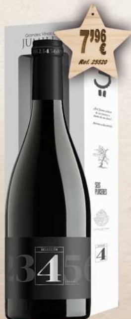
MAGNUM 1,5 L. Vino SELECCION 4 Roble D.O. Jumilla