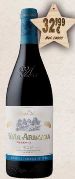
MAGNUM 1,5 L. Vino VIÑA ARDANZA Reserva D.O. Rioja